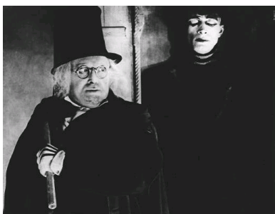
( Caligari mit Cesare)

Im Folgenden werden drei Szenen exemplarisch, vor allem im Hinblick auf expressionistischen Ausdruck, betrachtet. Zu jeder Szene wird ein Bild aus der entsprechenden Szene abgebildet.