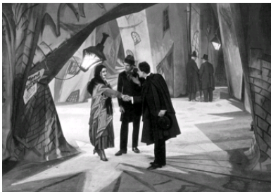
(Jane mit Alan und Francis)

Werner Krauß versteht es, wie hier zu erkennen ist, die zwielichtige Rolle des Dr. Caligari durch seine Gestik, Mimik und sein äußeres Erscheinungsbild meisterhaft auch im expressionistischen Hinblick auszufüllen. So füllen diese beiden Figuren die Rollenfunktionen nicht nur in dieser Szene, sondern im gesamten Film sehr stark mit expressionistischen Zügen aus.